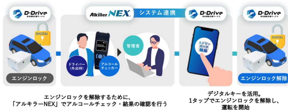
図:「アルキラーNEX」と「D-Drive」の連携イメージ

ドライバーが「アルキラーNEX」でアルコールチェックを行い、管理者が乗車許可を出すと、システム連携により「D-Drive」アプリからエンジンロックを解除するためのデジタルキーがダウンロードできます。