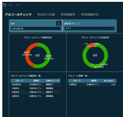
【アルコールチェック状況表示イメージ】