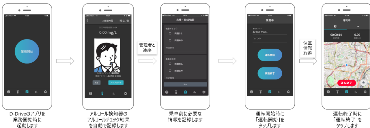
【業務開始から運転開始までの画面イメージ】

連続した操作でかんたんに「乗車前情報⇒運転前アルコールチェック⇒運転経路の記録⇒乗車後情報⇒運転後アルコールチェック」の記録ができます。乗車前後の情報には、車両点検・給油情報・有料道路利用状況などの入力が可能です。車両管理に必要な情報をクラウド管理ができます。