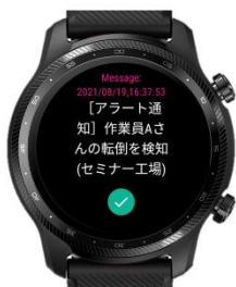
転倒・転落検知本人確認画面