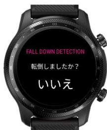
転倒・転落検知本人確認画面