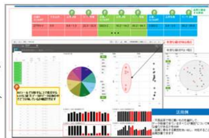
チョコ停時間を集計し定量的に見る化