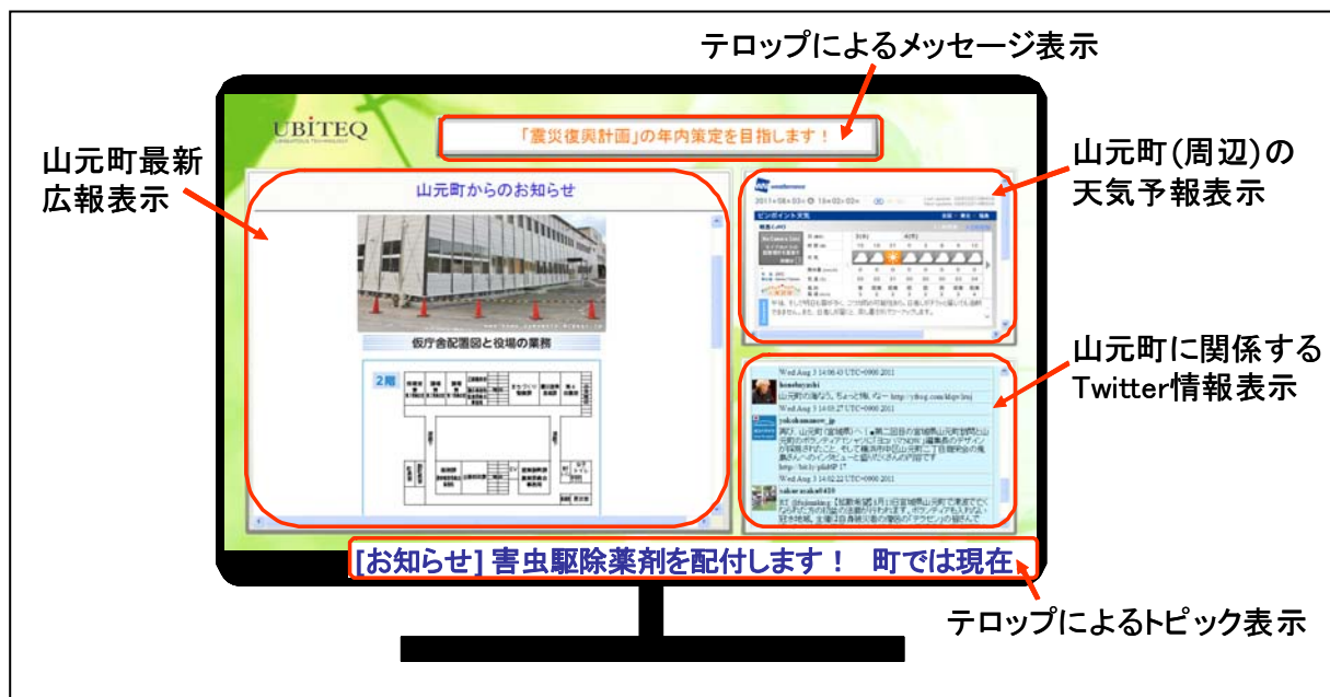
図2:「UGS 情報 POD」画面イメージ

今回の設置作業に際しては、ユビテックのインターンシップ制度を活用し、現役の大学生にも参画していただきました。また、今後の復興支援活動の輪をより広げるために、大学生の方々を対象に「UGS情報 POD」の運営をお手伝い頂くプログラムもスタートしております。