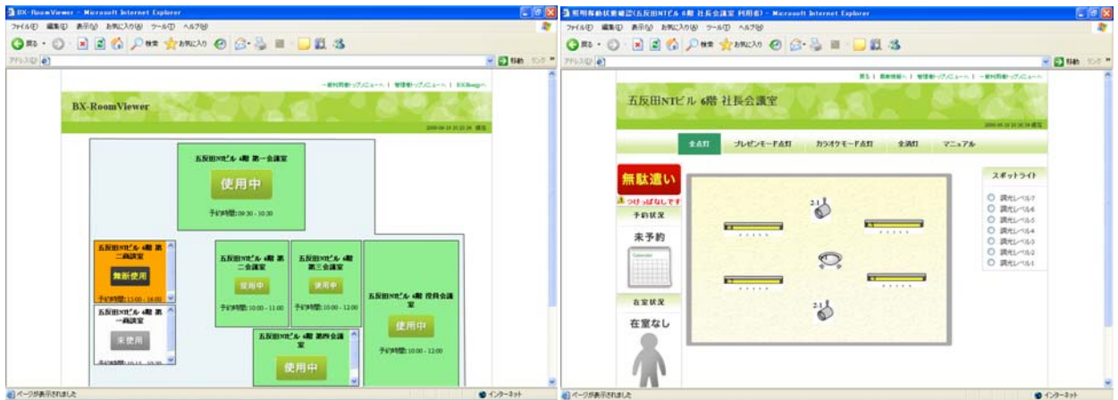
(図左：全ての会議室の状態を表す画面例)